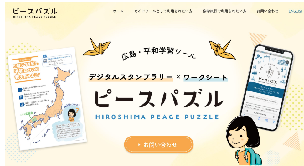
《スマホからの参加方法》