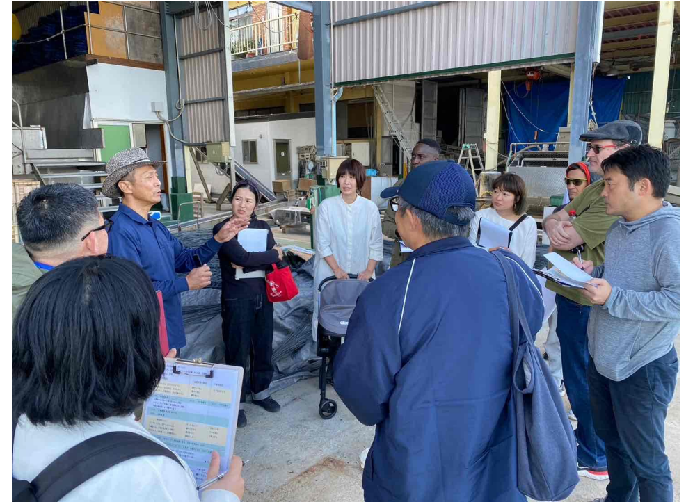
《現地モニターツアーの様子》