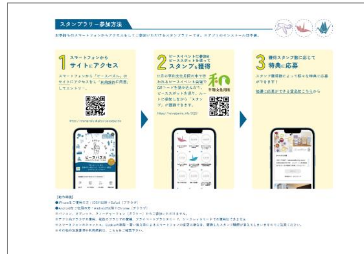
《スマホからの参加方法》