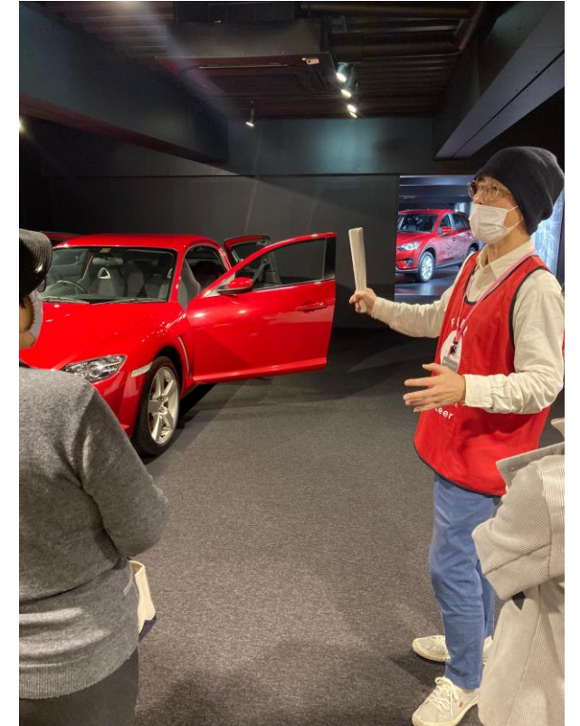
マツダミュージアム見学会