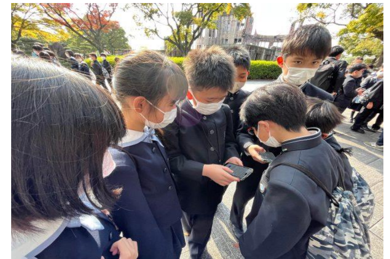
《ピースパズルの体験の様子》