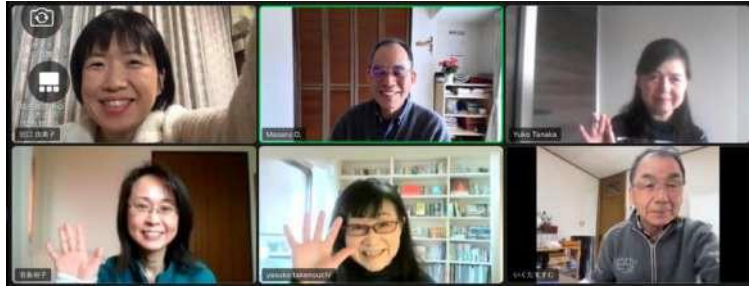
おしゃべりミーティング