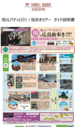
マイトラベルバディツアートライアル