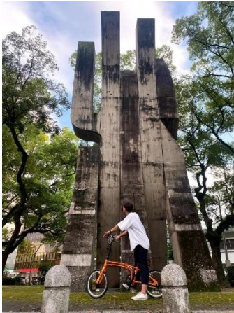
広島市内 サイクリングツアー