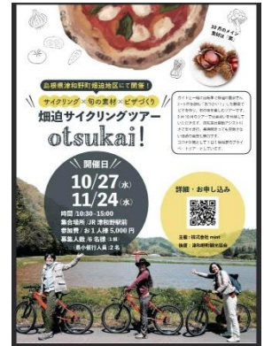
津和野 サイクリングツアー

HAC(広島体験型観光事業者連合会[Hiroshima Activity Consortium])と連携したモニターツアーを実施。さまざまな体験をつうじて広島の新たな魅力を知る機会となりました。駅での案内活動のときにもモニターツアーで体験したことをお話することもできそうです。