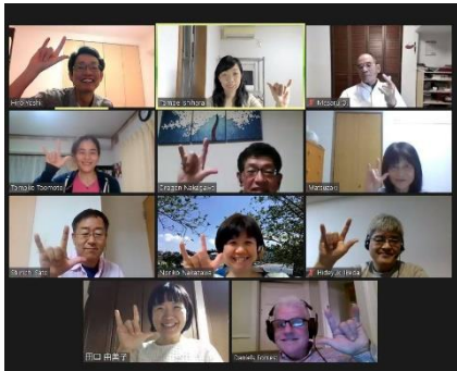
English Café (オンライン英会話)