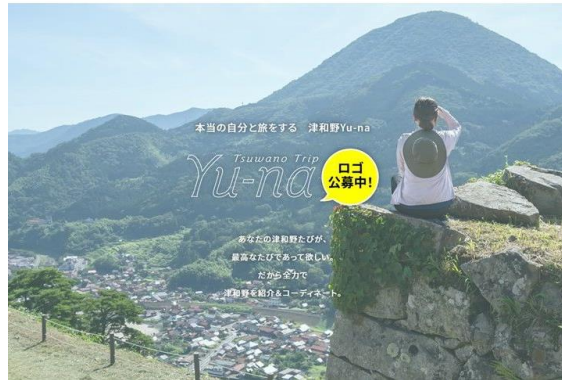
津和野Yu-na 津和野を愉しむための体験・滞在プラン