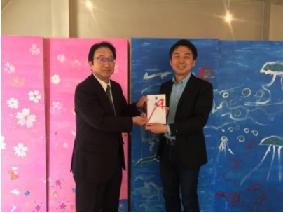
「YMセゾンカード」 第6回地域貢献寄付をいただきました。

今年も多くの方にご支援・ご協力をいただきました。これからも、広島駅でささやかながら外国人観光客の旅のサポートをすることで「広島は良い街だった」「広島人と話せて楽しかった」と笑顔で帰っていただけるように活動してまいります。