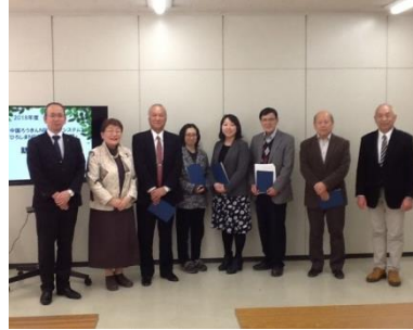
2018年度「ひろしまNPOサポート倶楽部」 寄付金の配分をいただきました。